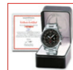
Inklusive von Hand nummeriertem Echtheits-Zertifikat und einer eleganten Präsentations-Box