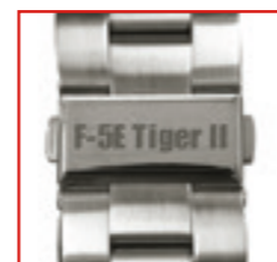
Mit „F-5E Tiger II“ Gravur auf dem Verschluss des Armbandes

Diese Sonder-Edition ist auf weltweit nur 5'000 Exemplare limitiert. Eine schnelle Reservation lohnt sich deshalb für Sie!