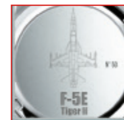
Auf der Rückseite werden die Nummern einzeln graviert